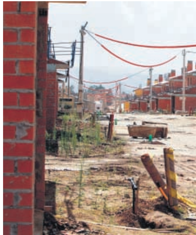
Urbanización de Martinsa-Fadesa, en el municipio coruñés de Miño, cuya construcción ha sido paralizada | KODIA

Otro de los aspectos analizados en la estadística del procedimiento concursal consiste en la segmentación de los datos en atención al sector de actividad de las empresas concursadas. En esta ocasión, tal como viene ocurriendo desde el principio de la crisis, asumen el protagonismo las actividades de cons-